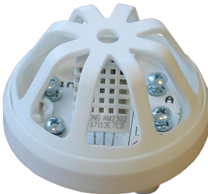
Рисунок 4.1 – Общий вид Термогигрометра МГП-СС, Вариант 1

Общий вид изделия с пластиковым корпусом, Рисунок 4.1, с металлическим корпусом, Рисунок 4.2